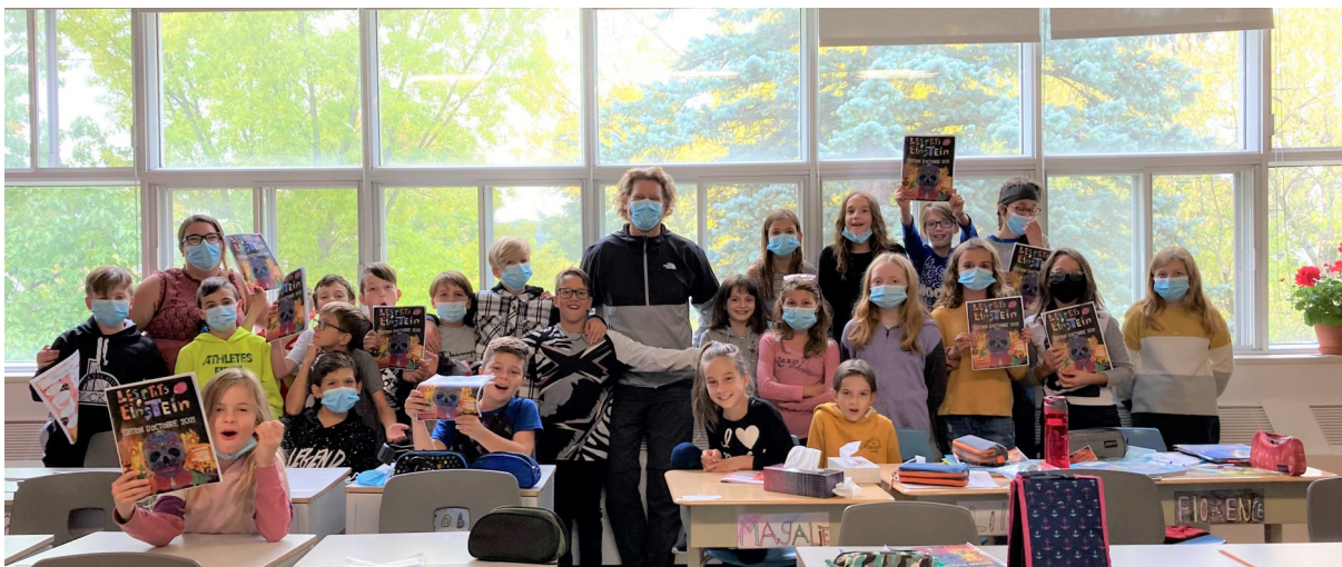
Club des Ptit's Einstein