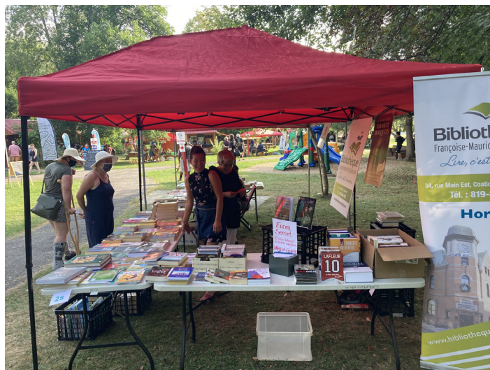
Kiosque de la bibliothèque et d'Aux Vieux Bouquins au Marché public de Compton