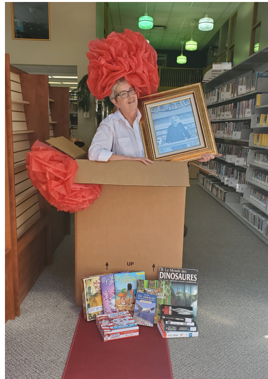
Événement Tapis Rouge

Les bénévoles d'Aux Vieux Bouquins s'assurent aussi de regarnir, au besoin, les croque-livres de la ville.