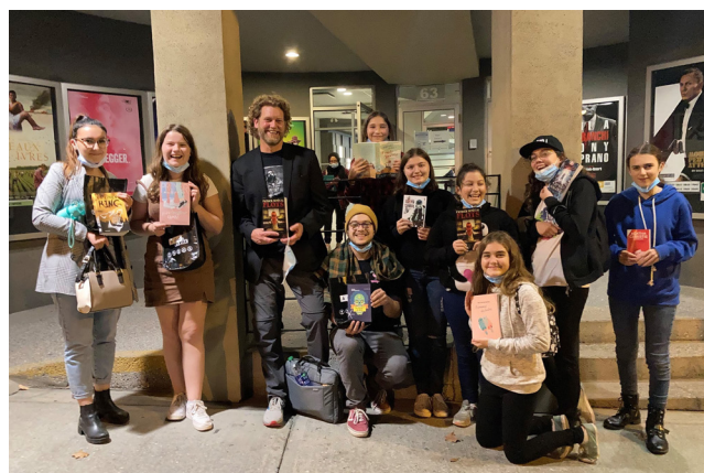
À Go on lit

Le directeur est le présentateur de la soirée de lancement de l'édition 2021 de À Go on lit, à la maison du cinéma, avec des ados et des animateurs de la Maison des jeunes de Coaticook.