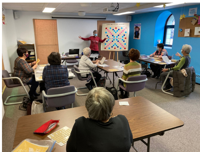
Club de scrabble

Un groupe d'adeptes de yoga se réunit tous les jeudis soir dans la salle d'animation.