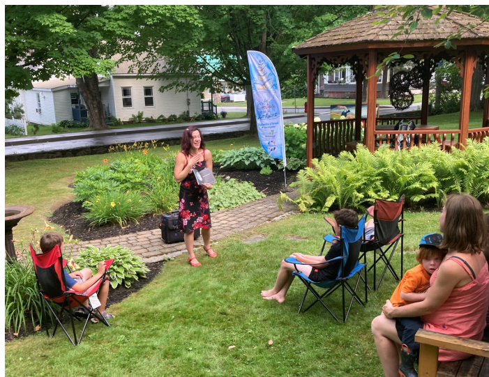
Contes de la fontaine

Contes de la fontaine Visites en camps de jour Lire pour le plaisir – Club TD