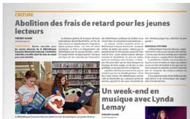
Page du journal Le Progrès avec l'article sur l'abolition des frais de retard

18 décembre – Le Progrès – Des marionnettes racontent la pandémie à Coaticook