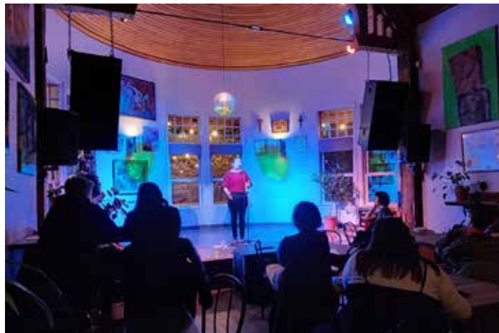
Soirée Des poètes et de la bière