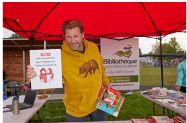
Fête de la rentrée