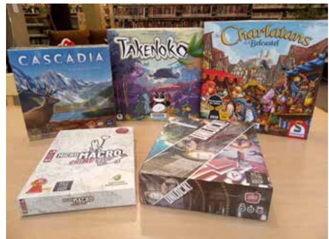
Création de la nouvelle section de jeux de société