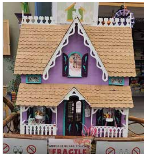
Maison de la Fée Betty