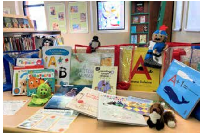
Trousses de Coco