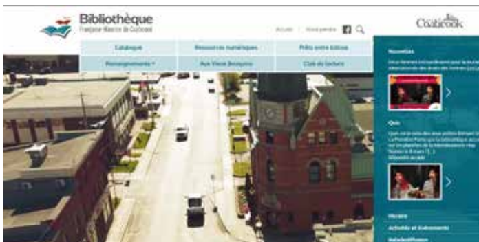
Nouveau site Web