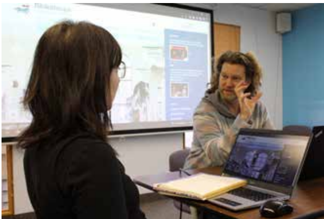
Ressource mutualisée de création de contenu

Les thématiques et les suggestions d'activités réparties par tranches d'âge ont assurément su ravir le regard et l'imaginaire des tout-petits.