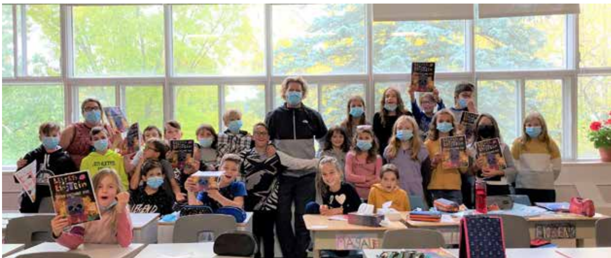
Club des P tits Einstein