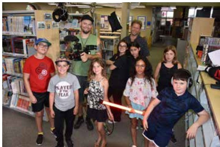
Atelier de cinéma, dans le cadre du camp Kionata