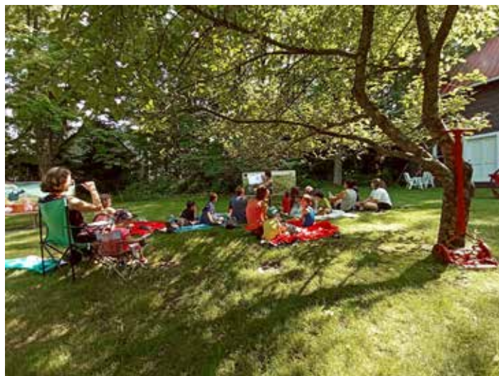
Contes de la fontaine

9 décembre au 14 février - Exposition « Et si on se racontait la pandémie »