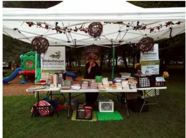
Kiosque de la bibliothèque au Marché de soir de Compton

9 octobre au 15 janvier - Exposition de Sylvie Marcoux