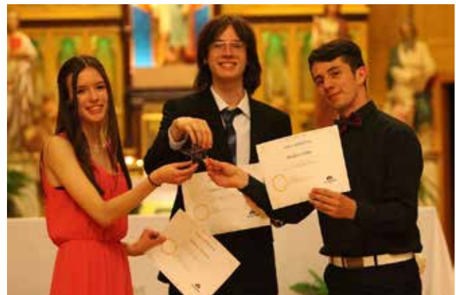
Méritas du Collège Rivier pour l'implication des jeunes dans la baladodiffusion

Nous croyons qu'une bibliothèque dynamique, déployant de nombreuses activités, contribue à l'atteinte de tels résultats, mais que l'ouverture aux plus jeunes générations est un gage important de la pérennité de nos actions et contribuera, dans le temps, au renforcement de notre mandat.