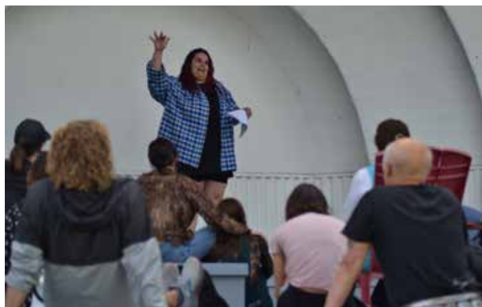
Déambulateur poétique «Quand les bottines suivent babines»