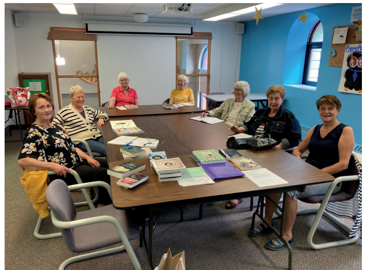
Club de lecture

10 octobre au 6 janvier – Exposition de Véronique Saumure, de Coatic'Art (vernissage le 26 octobre)