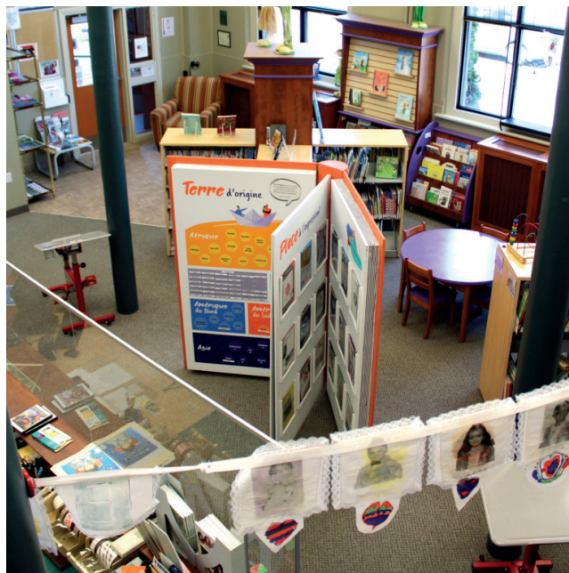
Livre géant du Centre d'éducation populaire de l'Estrie