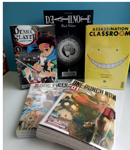
Mangas acquis en 2023

Aujourd'hui, la section Coup de cœur héberge des titres de 43 séries!