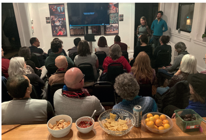
Projection du film Richelieu dans les locaux de la Société d'histoire