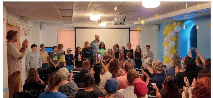
Première du film Démonicus II