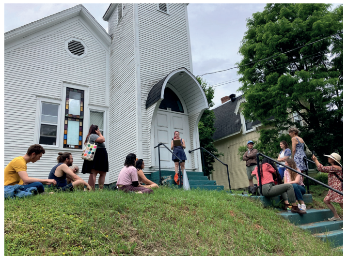
Parcours déambulatoire Quand les bottines suivent les babines