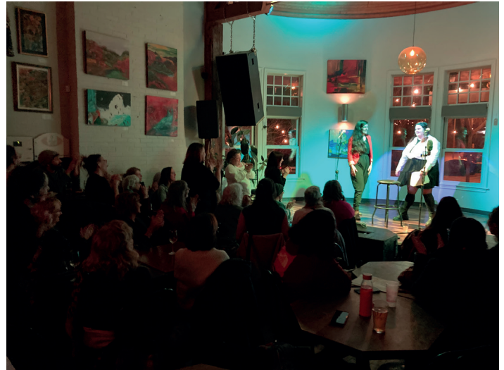
Bière littéraire avec le duo La première partie

26 août – L’heure du conte est au Festival interculturel Mas Latinos (avec CAAZ)