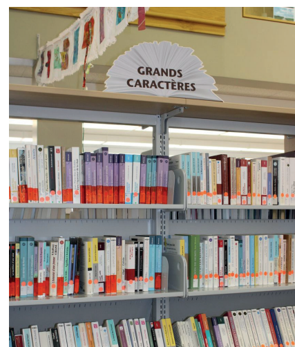
Section Grands caractères

Un petit pas pour rendre la littérature plus accessible!