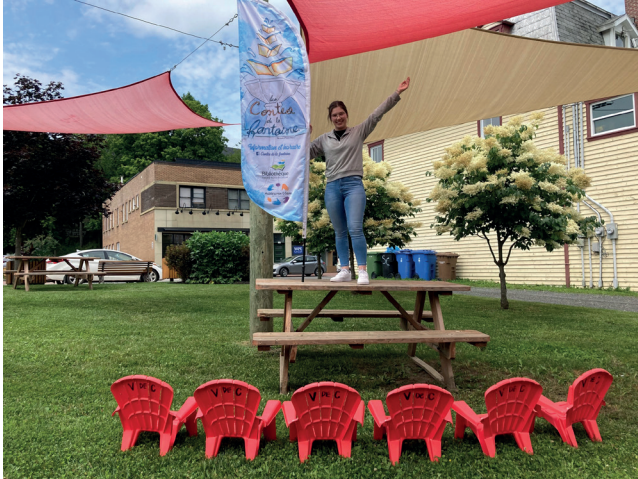
Mégane au Parc des ombrières pour Les contes de la fontaine

Les contes de la fontaine au Parc des ombrières. Tout l'été : l'initiative Lire pour le plaisir, quatre matinées par semaine. Visites en camps de jour.