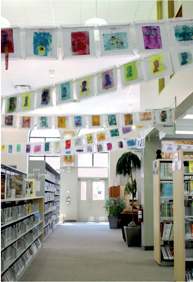
Exposition «Hissons nos couleurs»