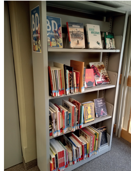
Section BD québécoise

On y retrouve autant les classiques que les nouveautés ; on y retrouve surtout des auteurs et autrices au talent fou!